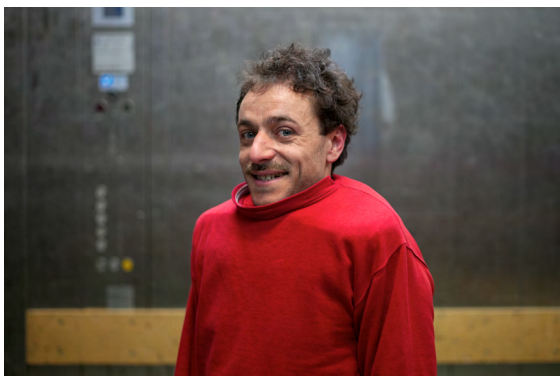
Philippe - création 2022