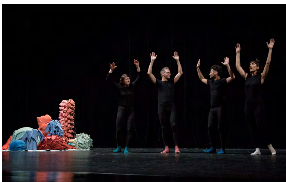
Un début de quelque chose - création 2023