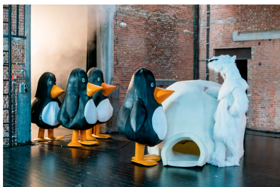
Ørigine - création 2018