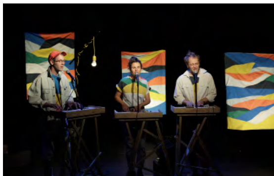
Vacances - création 2021