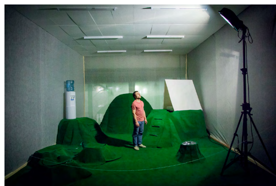
La colonie - création 2016