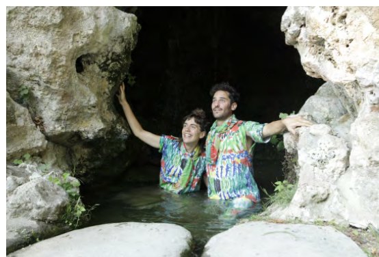
Romantisme - création 2020