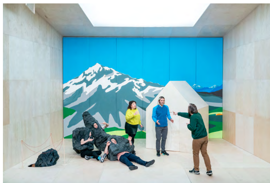
Abri - création 2022