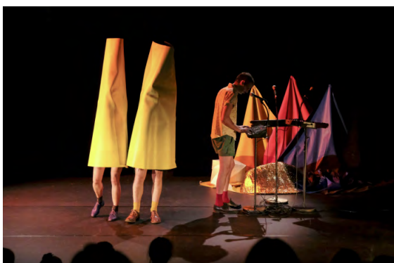
Panoramas - création 2017