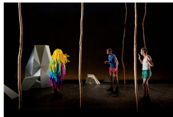
Petite Nature - création 2016