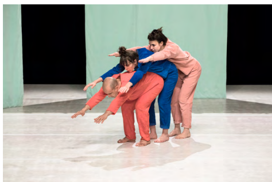
Un spectacle - création 2019